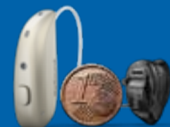
ReSound Vivia microRIE + Starkey Edge AI CIC

Ihr gutes Hören ist unsere Herzensangelegenheit. Bei Hörstudio Hessel beraten wir Sie ausführlich und stimmen das Hörgerät, das am besten zu Ihnen und Ihrem persönlichen Lebensstil passt, individuell auf Sie ab. Danach tragen Sie Ihre Hörgeräte 30 Tage lang kostenfrei und unverbindlich zur Probe und erhalten anschließend einen Testhörerbonus in Höhe von 100 €.*