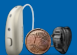
ReSound Vivia microRIE + Starkey Edge AI CIC

Machen Sie jetzt einen Termin für sich und Ihre Angehörigen: Wir prüfen Ihr Hörvermögen ausführlich und kostenlos. Die Ergebnisse gehen wir mit Ihnen durch und beraten Sie auf Wunsch persönlich zu Ihren optimalen Hörgeräten.